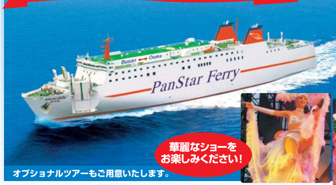
オプションツアーもご用意いたします。