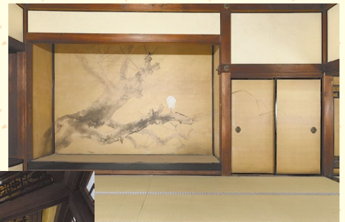
大寝殿 竹内栖鳳 障壁画「古柳眠鷺」