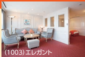
(1003)エレガント 定員2名(65㎡ 10階、展望/バス・トイレ・バルコニー付) ※ブルーレイプレーヤー、インターネット閲覧専用ノートパソコン付