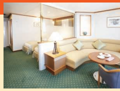
定員2名(35㎡ 10階、バス・トイレ・バルコニー付) ※ブルーレイプレーヤー付 ※スイートBは、救命ボートによりベランダの眺望が妨げられます。