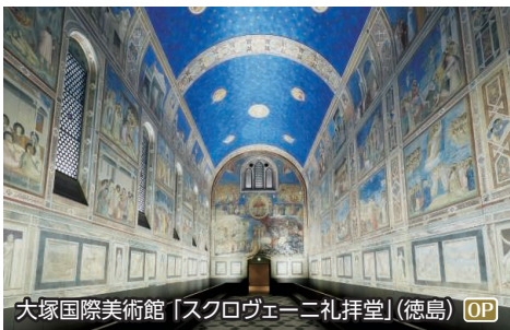
大塚国際美術館「スクロヴェーニ禮拜堂」(徳島) OP

写真は大塚国際美術館の展示作品を撮影したものです。陶板で西洋名画を原寸大に再現して展示