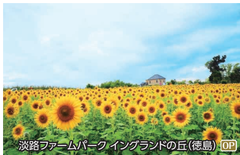
淡路ファームパーク イングランドの丘(徳島) OP

写真は大塚国際美術館の展示作品を撮影したものです。陶板で西洋名画を原寸大に再現して展示