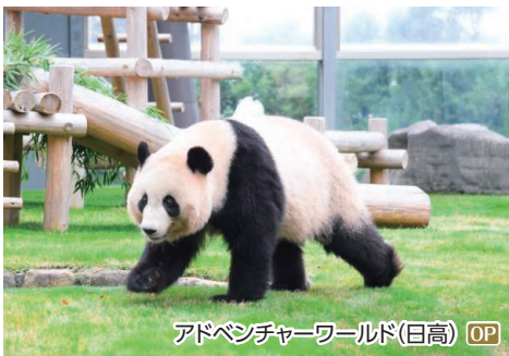
アドベンチャーワールド(日高) OP