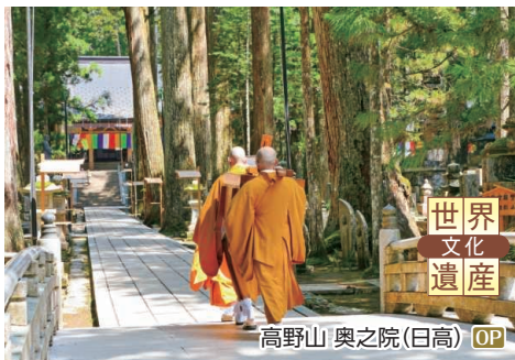
高野山 奥之院(日高) OP