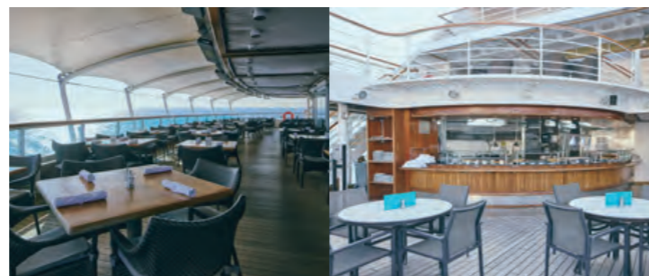
テラスレストラン 八葉