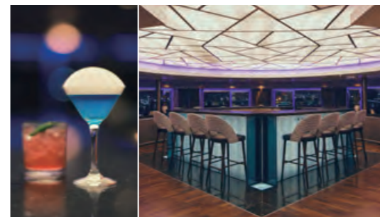
オブザーベーションバー 36