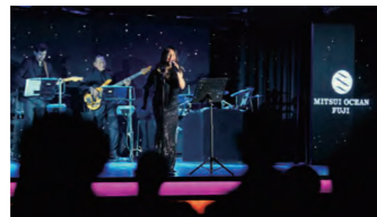
オーシャンステージ