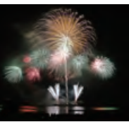
別府 クリスマスファンタジア