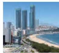
釜山 X the SKY