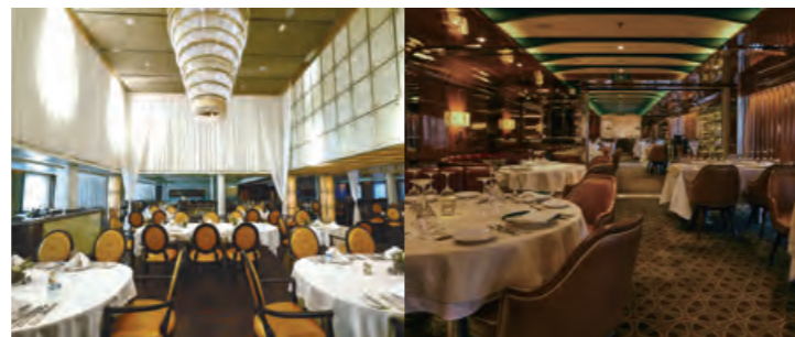
ザ・レストラン 富士

三井オーシャンフジが誇るのは、お好みに合わせて選べる4つのダイニング。日本中から取り揃えた旬の食材をふんだんに使ったシェフ自慢の料理をお好きなダイニングでお楽しみいただけます。本パンフレット掲載クルーズでは、クルーズ中1回、ザ・レストラン 富士で特別なクリスマスディナーをご用意。思い出に残るサイレントナイトをお約束します。