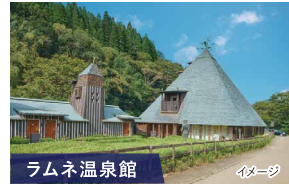
ラムネ温泉館 文豪・大佛次郎が「まるで、ラムネの湯」と表現した湯として知られています。炭酸ガスが豊富なぬる湯で、体に気泡がまわりつく心地よさが魅力です。

■出発日 2025年6月21日(土) 2025年7月26日(土) 2025年9月20日(土) ■最少催行人員:20名 ■添乗員:同行いたします。 ■利用バス会社:大分交通、国東観光バス、大交北部バス、玖珠観光バス ■旅行代金(おひとり様) ※2025年4月1日時点の情報です 6月 おとな 53,000円 子ども 37,600円 7月・9月 おとな 54,500円 子ども 39,100円 幼児(3歳以上)はバス席料として3,000円が必要となります。