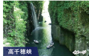
高千穂峡 「真名井の滝」や自然を肌で感じられる遊歩道、火山によってできた柱状節理など大自然を全身で感じられます。