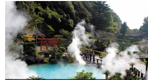
海地獄(別府地獄めぐり) 別府の人気観光地。コバルトブルーで涼しげですが泉温は約98度!自然の迫力と温泉の多様さを体感できます。