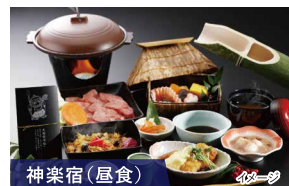
神楽宿 (昼食) 昔ながらの田舎の雰囲気を楽しみながら高千穂の郷土料理をお召し上がり頂きます。