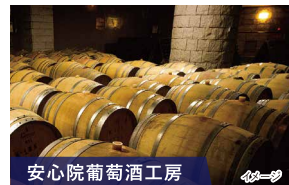
安心院葡萄酒工房 霧深い盆地ならではの寒暖差を活かし、良質なブドウを育て、ワインを醸すワイナリー。試飲もできます。

■出発日 2025年7月12日(土) 2025年9月6日(土) 2025年10月4日(土) ■最少催行人員:20名 ■添乗員:同行いたします。 ■利用バス会社:大分交通、国東観光バス、大交北部バス、玖珠観光バス ■旅行代金(おひとり様) ※2025年4月1日時点の情報です 7月 おとな 53,000円 子ども 37,600円 9月・10月 おとな 51,000円 子ども 35,600円 幼児(3歳以上)はバス席料として3,000円が必要となります。