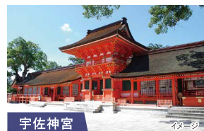
宇佐神宮 創建は725年。応神天皇を祀り、全国に4万社あまりある八幡様の総本宮として知られています。